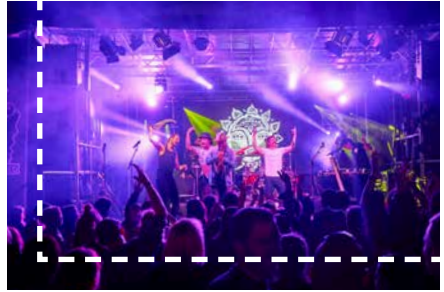
Erwin & Edwin

Der Kulturverein „Kunst im Keller“ (KiK) prägt seit 1989 das kulturelle Leben in Ried im Innkreis und bietet viele spannende Veranstaltungen: Konzerte, Theater, Lesungen, Kabarett und Ausstellungen. Mit einem vielfältigen Programm steht das KiK für hohe Wertschätzung aller Kunstformen und wurde auch 2008 mit dem „Großen Landeskulturpreis für Initiative Kulturarbeit“ ausgezeichnet.