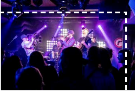
KiK OPEN AIR3