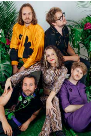
Mary Jane's Soundgarden | AMS | Imp da Dimp