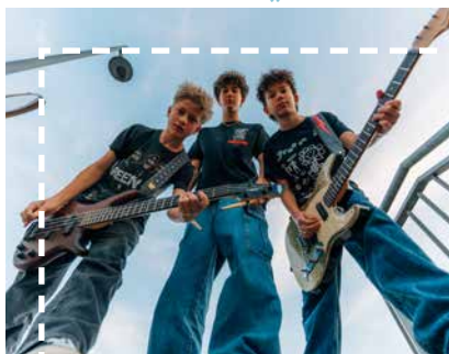
Newcomer Band „No Braids“

www.thebraidsmusic.com | Foto © Herbert Vogl